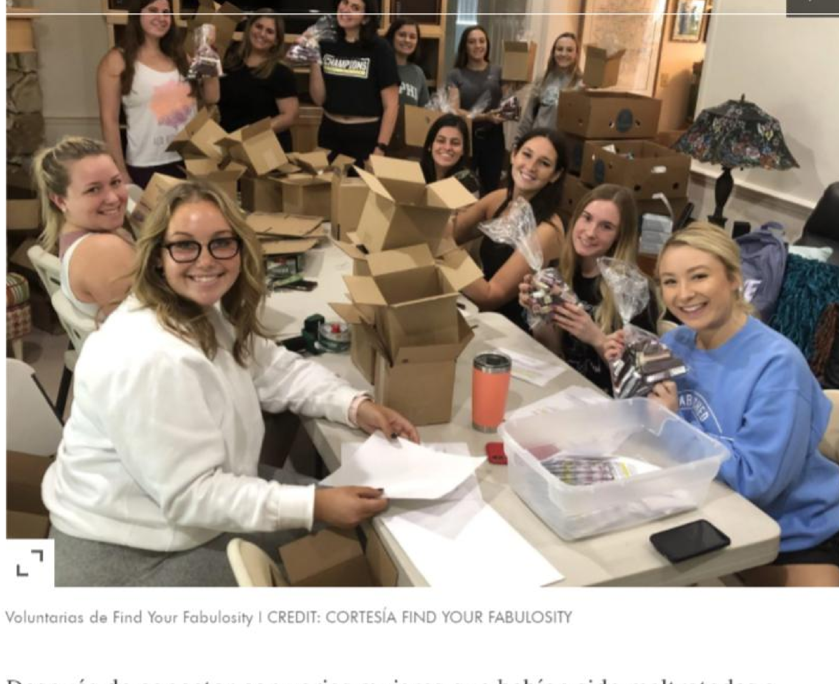
Voluntarias de Find Your Fabulosity

En el verano de 2015, mientras completaba una formación sobre violencia doméstica, se vio inspirada a emprender un nuevo proyecto. "Tuve quizás el mayor momento a-ha de mi vida", cuenta. "Pensé que ojalá pudiera tomar los programas que hacía en los campus universitarios y cambiarlos para adaptarlos a mujeres experimentando violencia doméstica y abuso".